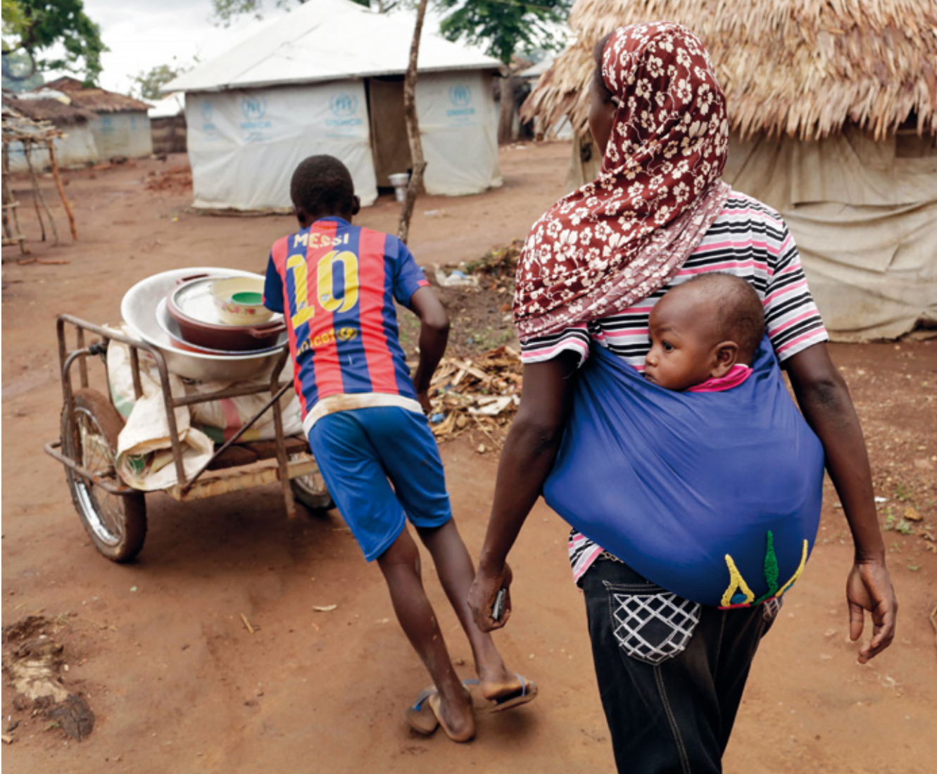
Konfliktit ja sodat vaikuttavat eri tavoin miehiin ja naisiin