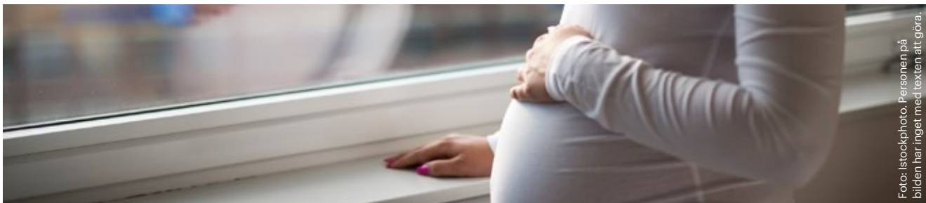
Personen på bilden har inget med texten att göra.