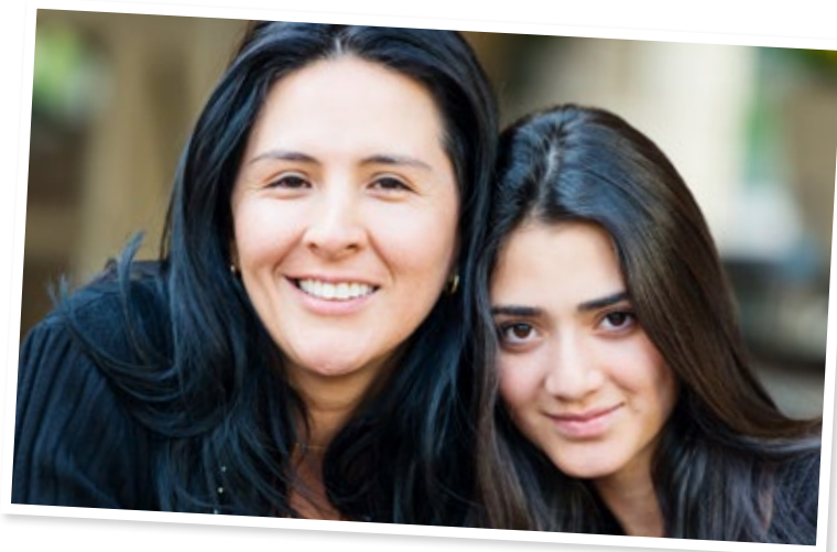
Foto: Istockphoto. Personerna på bilden är inte de som nämns i texten.

Tycker du att Nawres ska säga något till Samira? I så fall, vad ska hon säga?