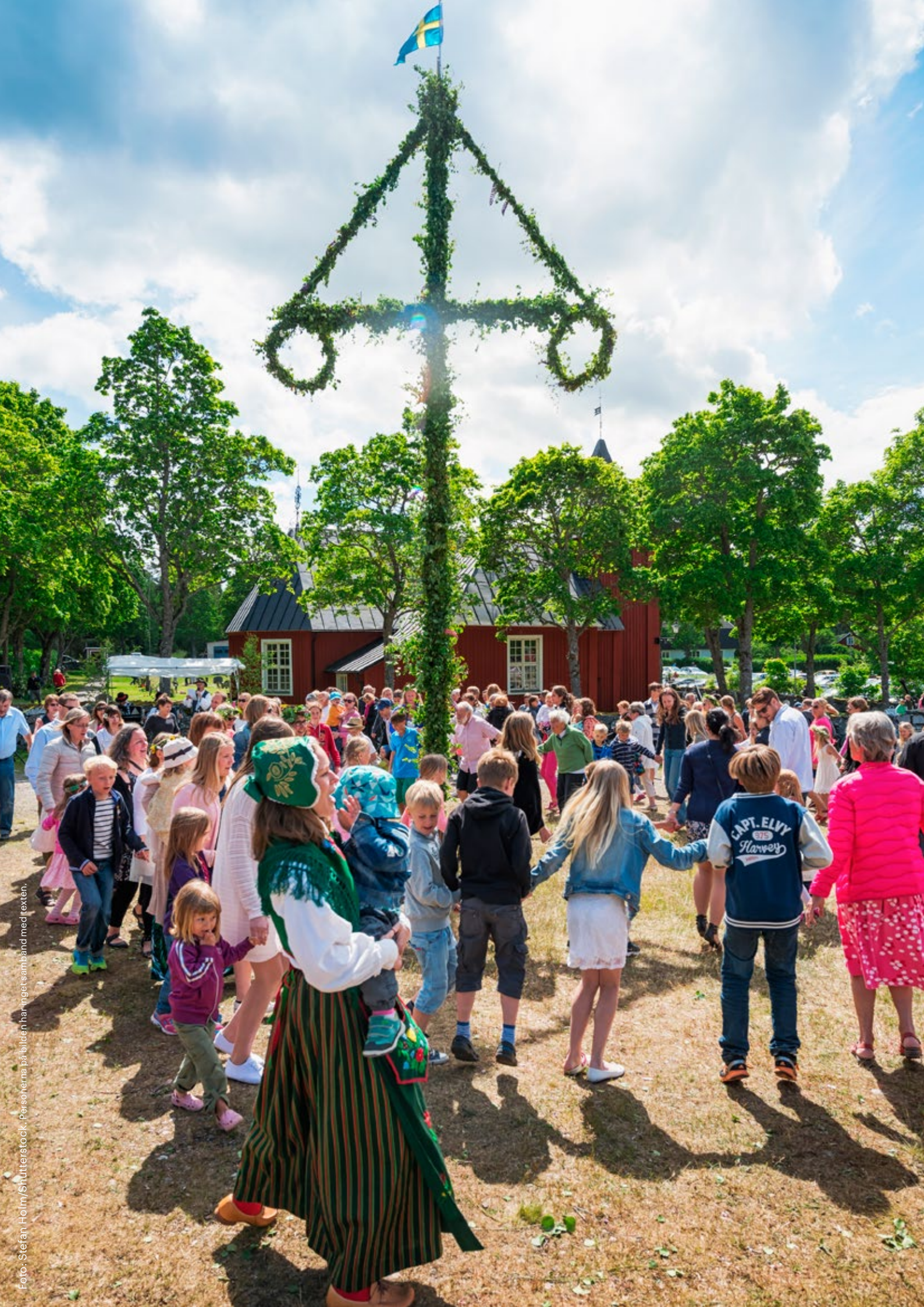
Foto: Stefan Holm/Snutterstock. Personerna på bilden har inget samband med texten.