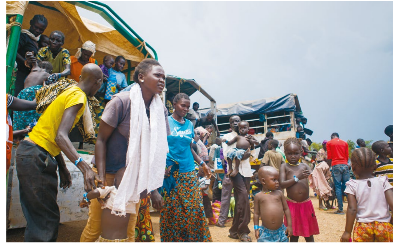
Ugandan ja Etelä-Sudanin välisen rajan ylittäneitä pakolaisia saapumassa Omugon vastaanottokeskukseen.

Kolme neljäsosaa Equatorian väestöstä on jättänyt kotinsa ja Luoteis-Uganda on kuin yhtä suurta pakolaisasutusta, jonka läpi ajaminen kestää tuntikausia.