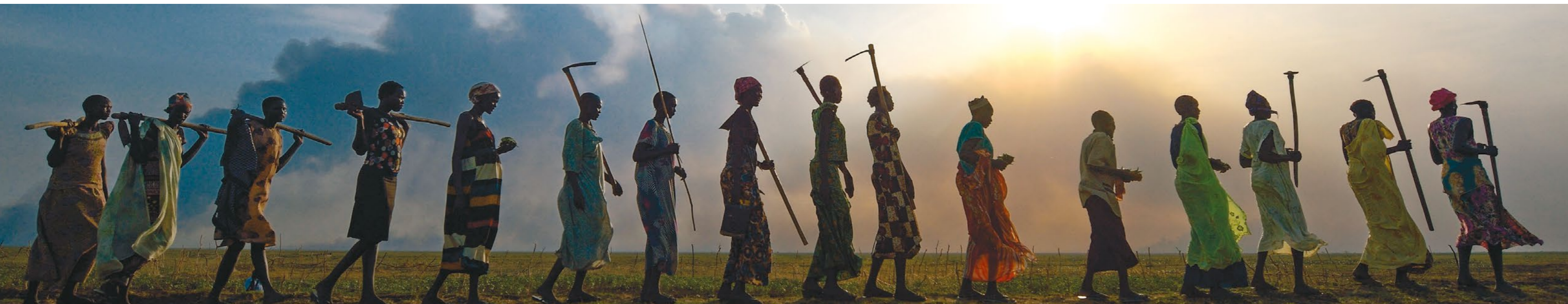
Joukko naisia palaamassa kotiin Dong Bomassa Jonglein osavaltiossa. Kirkon Ulkomaanapu työskentelee Etelä-Sudanissa muun muassa Jongleissa, joka kuuluu maan vähiten kehittyneisiin osavaltioihin.

KUA on syksystä lähtien toteuttanut ruokaturvahanketta 100 000 eurolla katastrofikeräyksen varoja. Hanke sisältää viljelykoulutuksen 500 maanviljelijälle, ja koulutukseen osallistuneille jaetaan siemeniä ja työkaluja.