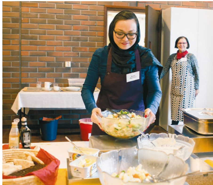
Pöytä on katettu. Ravintola Salaamin tarkoitus on edistää yhteisöllisyyttä ja turvapaikanhakijoiden kotoutumista.