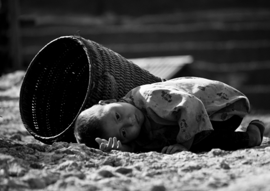
Många unga var tvungna att arbeta i början av 1900-talet.