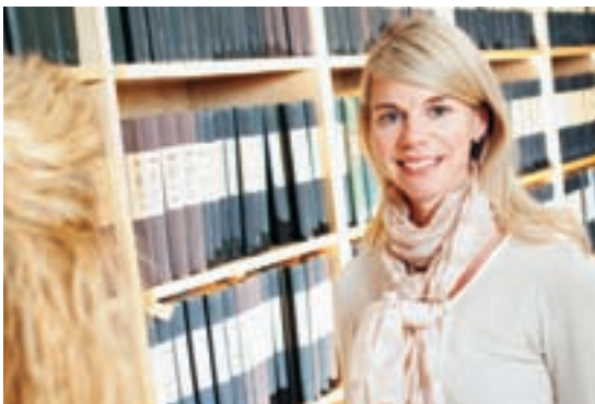
Justitiesekreterarna bereder och föredrar målen och presenterar förslag till domar och beslut.

Högsta förvaltningsdomstolen prövar avgöranden som överklagats från någon av de fyra kammarrätterna i landet.